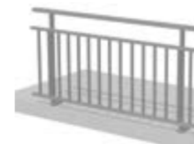
Barreaudage sous lisse intermédiaire