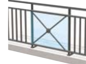
Bande filante sous lisse avec barreaudage et croix de Saint-André