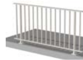
Barreaudage sous main courante