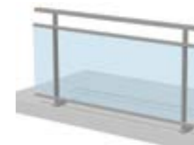
Bande filante sous lisse avec remplissage verre