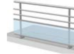
Bande filante version «paquebot»