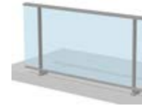
Remplissage verre sous main courante